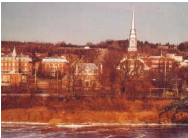
Réf. photo : 90, p. couverture

Vue de Saint-Joseph. De gauche à droite, le musée Marius-Barbeau (anciennement couvent), l'orphelinat, le presbytère, l'église et l'école Lambert (ouverte en 1912)