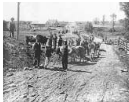
Photo de droite : sur la route internationale Lévis-Jackman, qui est alors élargie et, par endroits, relevée, pour pallier les inconvénients des inondations