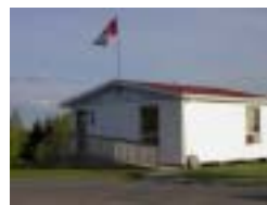
Réf. photo : 4

Corporation de développement touristique de Sainte-Marie 270, rue Marguerite-Bourgeoys Sainte-Marie-de-Beauce (Québec) G6E 3C7 Tél. : (418) 387-3233