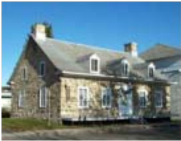
Réf. photo : 100