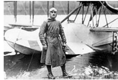
Réf. photo : 100