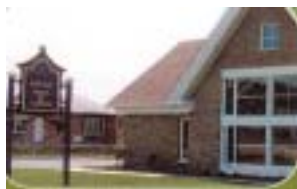
Réf. photo : 3

Pour plus de renseignements sur les sites touristiques à visiter en Beauce, contactez :