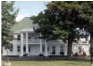
Réf. photo : 88 (nn)