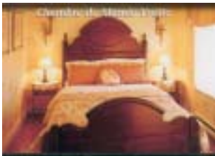
Réf. photo : 88 (nn)

Le manoir Taschereau , construit en 1809, fut la résidence du seigneur Jean-Thomas Taschereau et est aussi la maison natale d'Elzéar-Alexandre Taschereau, né en 1820. Celui-ci, ordonné prêtre en septembre 1842, devint évêque puis archevêque, avant d'être promu cardinal en 1886, devenant ainsi le premier Canadien à se voir attribuer cette dignité. Le Cardinal avait promis que la Beauce aurait son évêché avant la fin du monde . D'autres illustres descendants des Taschereau sont également issus de cette lignée : députés, juges à la Cour supérieure et à la Cour suprême, juges en chef et même un premier ministre du Québec (Louis-Alexandre Taschereau occupa cette charge de 1920 à 1936). Le manoir est l'un des plus prestigieux témoins de l'époque seigneuriale en Beauce. De nos jours, c'est un site historique et un gîte du passant. Les colonnes et les terrasses ont été ajoutées vers 1940, lui conférant une allure plus coloniale qui rappelle les grandes demeures des plantations de coton de Louisiane.