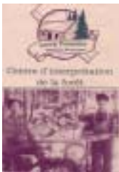
Réf. photo : 101