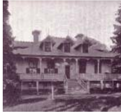
Réf. photo : 84, p. 113 (1927)