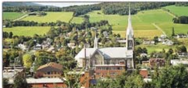
L'église de Sainte-Marie