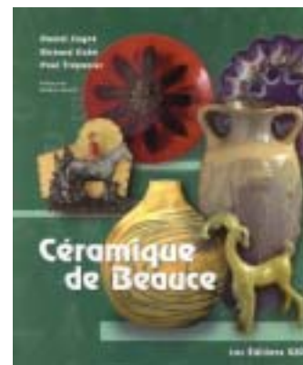
Réf. photo : 24, p. couverture

Depuis le 23 février 2004, le musée Marius-Barbeau propose une exposition rétrospective intitulée Céramique de Beauce 1940-1989 qui permet de comprendre l'évolution de cette entreprise créée par l'État pour stimuler l'économie et ralentir l'exode rural. On peut y contempler plus de 600 pièces de collections diverses.