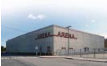
Réf. photo : 88 (eee)

Terminons par une note sportive en mentionnant le magnifique club de Golf de Beauce à Sainte-Marie et l'omniprésente aréna où se disputent des games de hockey mémorables.