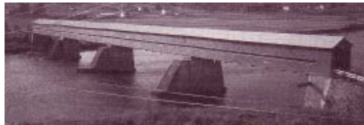
Réf. photo : 24, p. 907