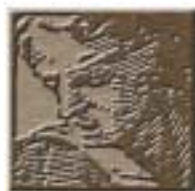
Réf. photo : 73, p. couverture