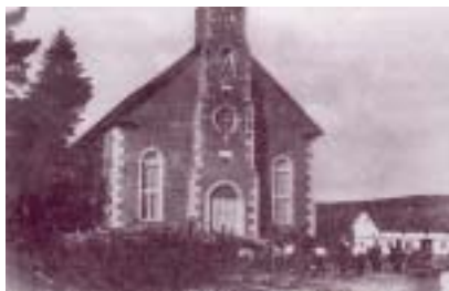
Réf. photo : 34 (b) p. 30 (1917)

À côté du manoir se dresse la chapelle Sainte-Anne . La première chapelle a été érigée en 1778 afin de satisfaire la piété des Beaucerons envers la bonne Sainte-Anne-de-Beauce, et les préserver des inondations. Cette piété, c'est la dévotion à Sainte-Anne-de-Beaupré, secours des naufragés et protectrice de tous les périls de l'onde, transposée en Beauce. La chapelle actuelle date de 1891. Le 26 juillet de chaque année, elle accueille des pèlerins de la région et d'ailleurs. Une neuvaine précède ce pèlerinage annuel, dont la popularité s'explique par les indulgences qui y sont rattachées.