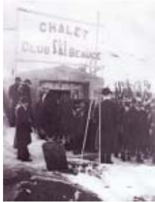
Réf. photo : 88 (bb)