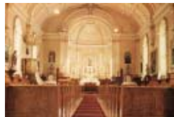
Réf. photo : 18