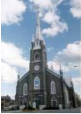
Réf. photo : 88 (eee)

L' église de Sainte-Marie fut construite entre 1856 et 1859. Elle est la première église de style néo-gothique construite au Canada. Un endroit magique pour célébrer la messe de minuit à Noël ! On peut y admirer la Madone des Croisades recouverte de feuilles d'or.