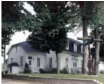
Réf. photo : 100

Gédéon , personnage de Doris Lussier. (Où l'on retrouve le potter de Doris Lussier, fait en pissette de beuf 1 auquel il est fait allusion dans l'adaptation). La maison, construite en 1893 par Hermias Dupuis, est aussi le siège de la Société historique de Nouvelle-Beauce , fondée en 1982.