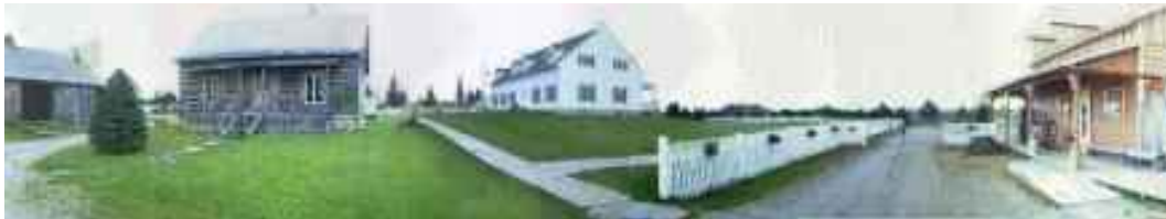
Réf. photo : 100