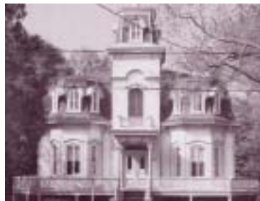
Réf. photo : 11, p. 260