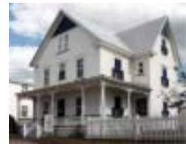
Réf. photo : 88 (eee)

La maison J.-A. Vachon est l'attrait touristique le plus fréquenté de Beauce. Elle est constituée de la demeure ancestrale de Rose-Anne et Arcade Vachon et de leur boulangerie acquise en 1923. On y retrace l'histoire du succès de cette entreprise familiale devenue une PME, puis une usine de production de masse. On peut y admirer le plus vieux gâteau de noces du monde conservé 2 , et homologué par le Livre des Records Guinness .