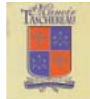
Réf. photo : 88 (nn)