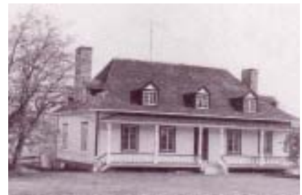
Réf. photo : 11, p. 249