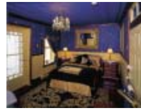
Réf. photo : 88 (nn)