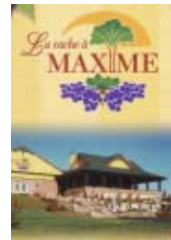
Réf. photo : 100

Signalons également le Village des défricheurs de Saint-Prosper; le Camp Forestier de Saint-Luc, le musée de la Motoneige antique Nouvelle-Beauce de Scott (fermé depuis novembre 2000. Sur cet emplacement, on trouve maintenant La cache à Maxime 4 ), le magasin général de Sainte-Rose-de-Watford, le musée antique Victor-Bélanger de Saint-Côme-Linière où l'on peut admirer divers objets anciens dont ceux qui ont meublé la maison des Poulin (meubles, téléphones, lampes à huile, gramophones, etc.), ainsi qu'une collection de voitures. Un village de la fin du XIX e siècle a également été reconstitué; le village miniature Baillargeon et le musée de l'Entrepreneurship beauceron (Centre culturel Marie-Fitzbach) de Saint-Georges qui retrace l'œuvre de ses pionniers et décrit par dix commandements , les règles à suivre pour que se répète le miracle économique beauceron .