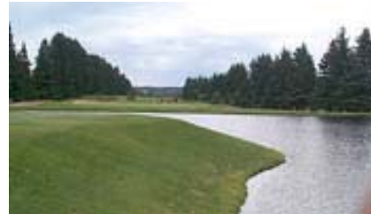
Réf. photo : 88 (eee)