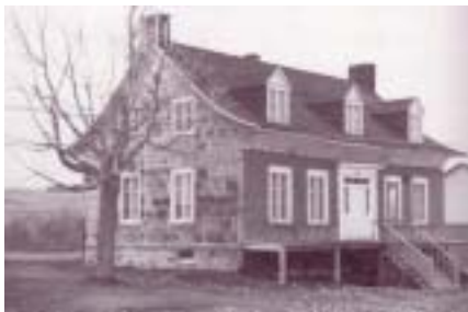
Réf. photo : 11, p. 252

Sainte-Marie possède le plus grand nombre de maisons anciennes et forme l'ensemble le plus diversifié de la Beauce, peut-on lire dans l'ouvrage La Beauce et les Beaucerons en page 247. Celles-ci, situées dans le Vieux-Sainte-Marie, font partie du circuit patrimonial de la rue Notre-Dame, mis sur pied par la municipalité.