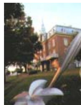
Réf. photo : 88 (pp)

Le musée Marius-Barbeau , situé à Saint-Joseph , est une vraie mine de renseignements sur les Jarrets Noirs que l'on peut découvrir en visitant l'exposition La Beauce, pays de légendes et de volonté qui présente plus de 260 années d'histoire de ce coin de pays. Le musée y présente aussi des expositions liées à l'histoire de ces gens qui ont façonné la Beauce et, à l'occasion, d'autres qui portent sur des artistes de la région. La dénomination du musée rappelle le souvenir du premier ethnologue québécois, Marius Barbeau , originaire de Sainte-Marie. Pour les marcheurs amateurs d'architecture et d'histoire, le Circuit de la Gorgendière , produit par le musée Marius-Barbeau permet de découvrir l'histoire du berceau de la Beauce par son patrimoine bâti.