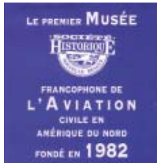
Réf. photo : 100