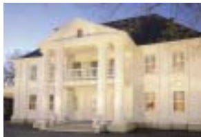
Réf. photo : 88 (nn)