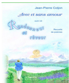
1 er double recueil de poèmes

Il a également adapté au contexte de la Beauce québécoise des années 1920, la comédie belge la plus jouée au monde, Le Mariage de M lle Beulemans , devenue Le Mariage de Marie à Gusse à Baptisse . Celle-ci a fait l'objet de cinq productions et de vingt représentations devant près de 4 000 spectateurs enthousiastes du Québec et de l'Ontario.