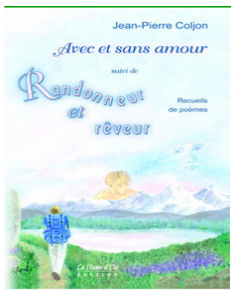
1 er double recueil de poèmes

Les lancements auront lieu aux dates suivantes :