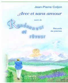
1 er & 2 e recueils de poèmes

Québec, le 9 février 2011 – Nous avons le plaisir de vous annoncer que le poète belgo-qubécois Jean-Pierre Coljon lancera son troisième recueil de poèmes intitulé Beau parleur , le dimanche 15 mai à 14 h 30 (avant le collectif de poètes québécois Rhizome) à la Maison de la Poésie et de la Langue française Wallonie-Bruxelles , 22 rue Fumal à Namur